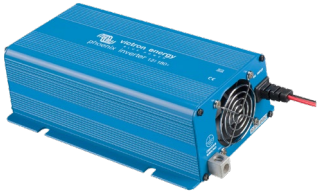
Phoenix Inverter 12/180