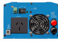
Phoenix Inverter 12/800 with AN/NZS 3112 socket