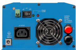
Phoenix Inverter 12/800 with IEC-320 socket