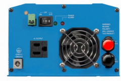
Phoenix Inverter 12/800 with Nema 5-15R socket