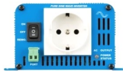
Phoenix Inverter 12/180 with Schuko socket