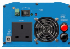
Phoenix Inverter 12/800 with BS 1363 socket